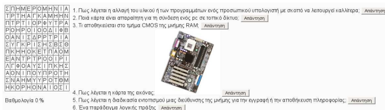
Εικόνα 2: Κρυπτόλεξο

Στη συνέχεια ζητείται από τον κάθε μαθητή να ασχοληθεί με την δραστηριότητα «κρυπτόλεξο» του ηλεκτρονικού μαθήματος, προσπαθώντας να αναγνωρίσει τις «κρυμμένες» λέξεις –όρους που αφορούν τις ερωτήσεις του παιχνιδιού. Στο τέλος ο κάθε μαθητής ανακοινώνει το βαθμό επιτυχίας του στο παιχνίδι και οι βαθμοί καταγράφονται στον πίνακα. (διάρκεια δραστηριότητας 5')